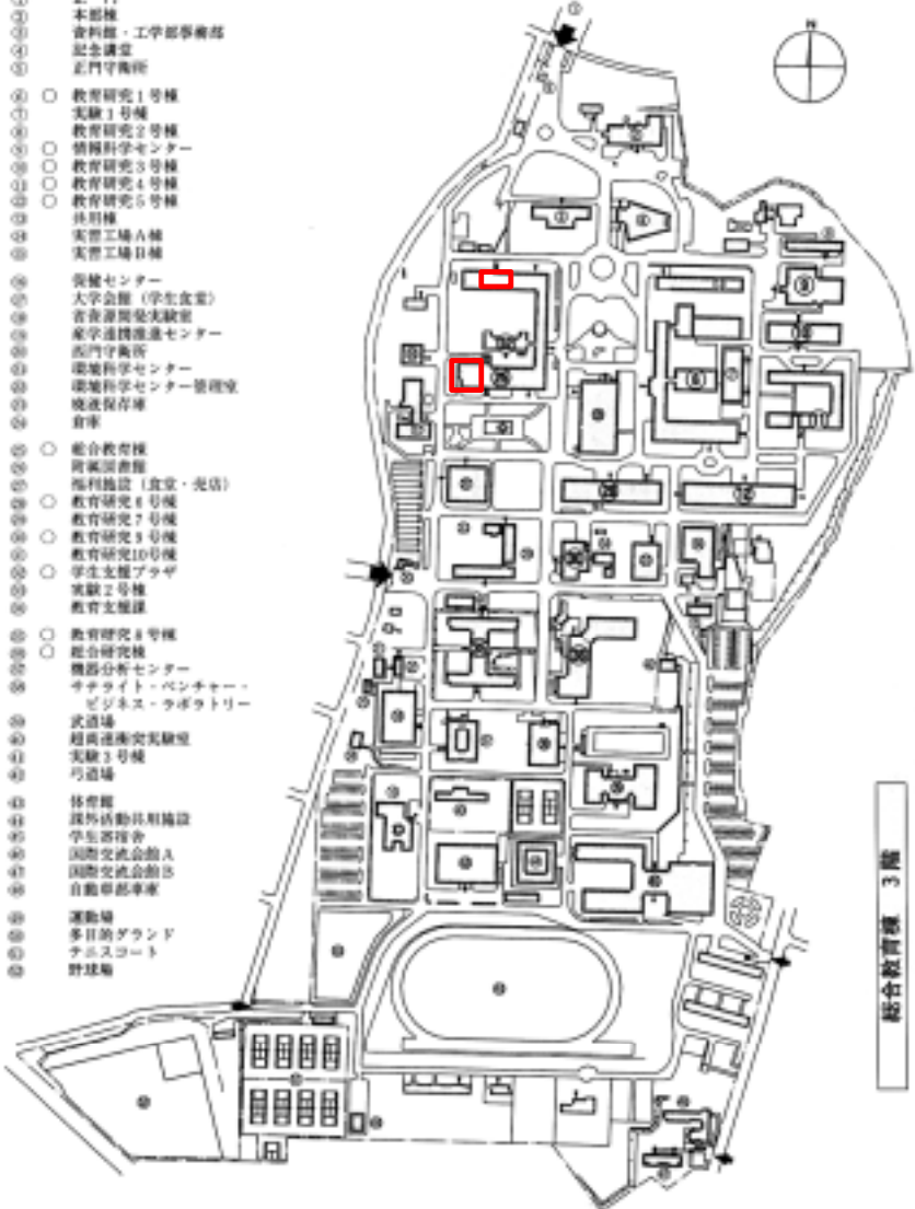
建物配置図 (戸畑キャンパス)