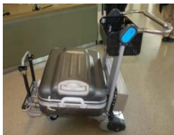
空港用手荷物カートロボット