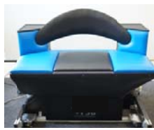
バランス訓練ロボット