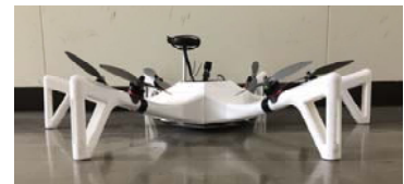
平行移動式ドローン

また、北九州ロボットフォーラム事務局ではテーマに関する技術的な相談や実用化に関する相談も随時受け付けておりますので、こちらもお気軽にご利用ください。