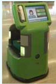
空港案内搬送ロボット