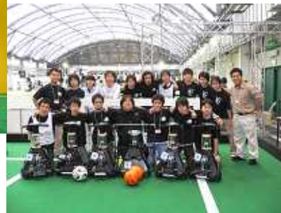
優勝を祝して記念撮影