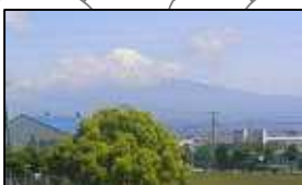
JR東海道線から見た富士山、ムサシも頂点に。