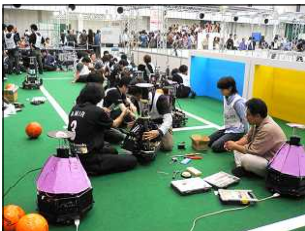
試合前の準備の様子 緊張した様子が伝わってきます

新ルールでは、従来の色ありゴールから色なしゴールへ変更され、対応できたチームは新ルールで参戦しました。