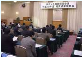
成果発表会の様子

本成果発表会の一部は来る7月2日に「ウェルシティ小倉」にて開催されるロボット産業振興会議の定時総会においても御紹介があります。