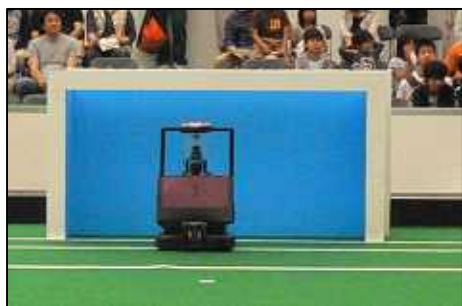
従来 色ありゴール