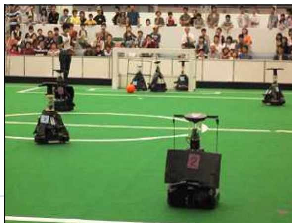
最終戦 EIGEN Keio Univ. (慶應義塾大学) との激しい攻防を征し、1-0で勝利しました。