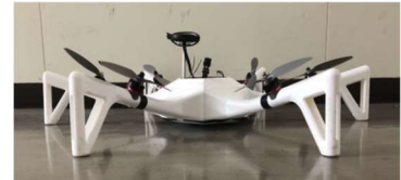
平行移動式ドローン