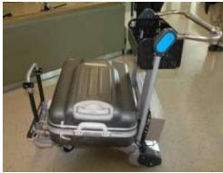
空港の手荷物運搬ロボット