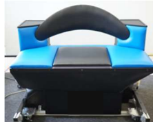
バランス訓練ロボット