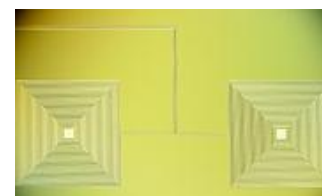
図2 作製した一辺が1mmのコイル部

今年度目標の一辺が1mmのコイル部を作製し(図2)、一次評価により電流計測が可能であることを確認できた。またセンサ作製の基本プロセスも確立することができた。