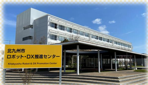
北九州市 ロボット・DX推進センター Kitakyushu Robot & DX Promotion Center

ロボットキャラバントラック 展示：11:00~15:30【雨天中止】 (展示見学のみは事前予約不要)